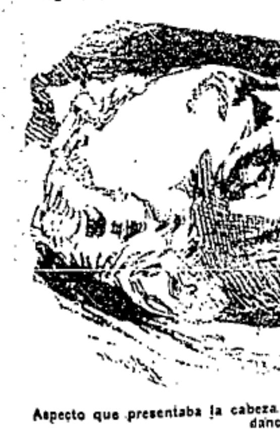
Aspecto que presentaba la cabeza del Gral. Reyes en la Comandancia Militar.

Con mucha insistencia circuló ayer el rumor de que don Francisco I. Madero y algunos de los miembros de su gabinete, habían presentado sus renuncias y decidido poner el Gobierno en manos de un presidente provisional. Dichos rumores, de los que se hicieron eco algunos de nuestros colegas, carecen por completo de fundamento, pues el mismo señor Madero declaró ayer que estaba dispuesto á sostener á todo trance la bandera de la legalidad.