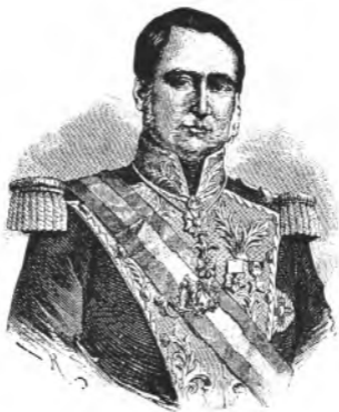
DON MARIANO ARISTA.