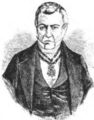
D. MANUEL DE LA PEÑA Y PEÑA.