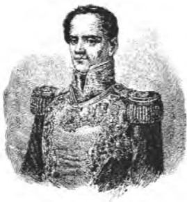
ANTONIO LÓPEZ DE SANTA-ANNA .