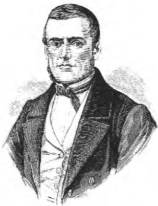
D. MIGUEL LERDO DE TEJADA.