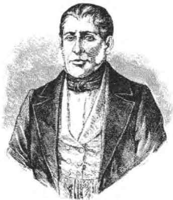
D. JOSE JOAQUIN DE HERRERA.